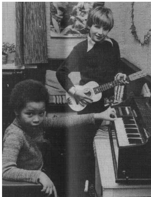
14. Kinderen in de Vluchtheuvel met hun muziekinstrumenten.

betere baan kunnen krijgen en vertrekken.