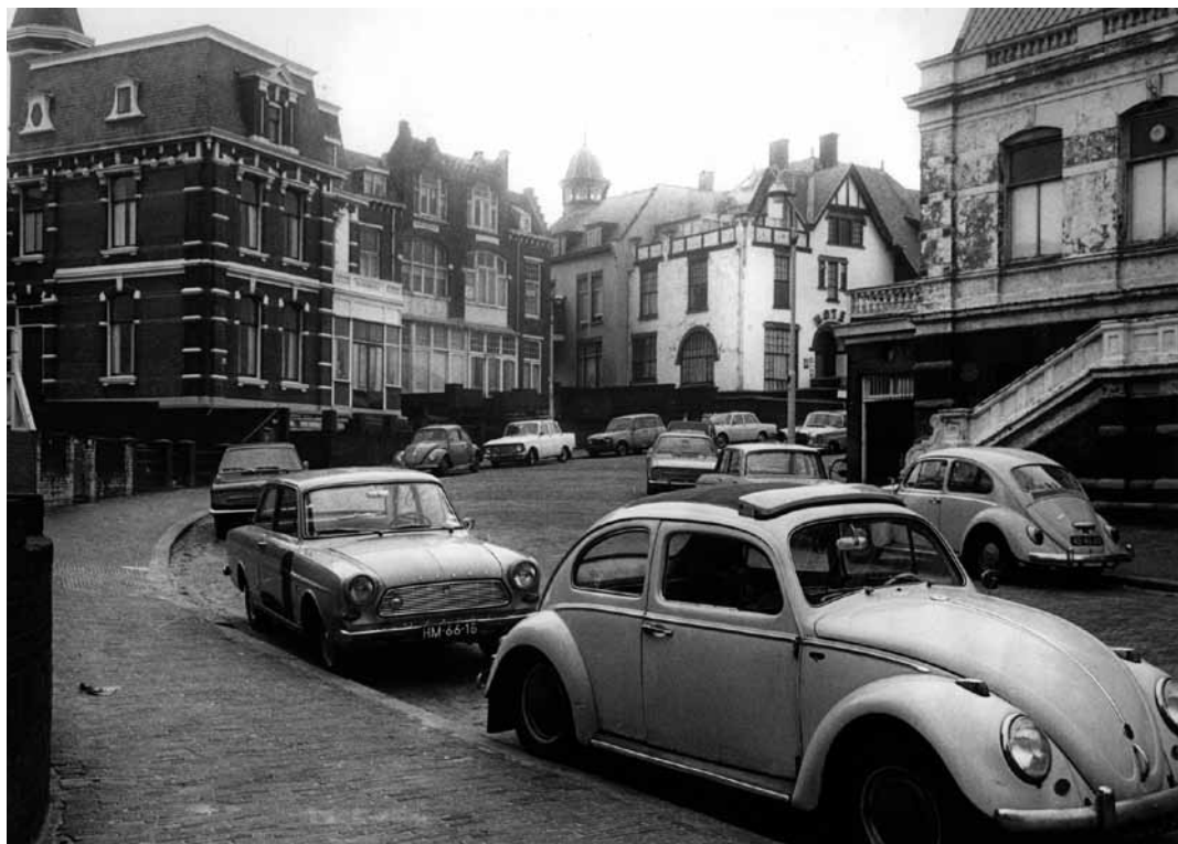
11. Seinpostduin omstreeks 1960. Het huis links is op dat moment in gebruik bij Vluchtheuvel.

kinderen. De prijs die ervoor moet worden betaald is echter hoog. Voor de aankoop (inclusief overdrachtskosten) is een bedrag van f 60.300 nodig en voor de verbouwing en aanpassing, naar schatting nog eens f 29.200. Om dat bedrag bij elkaar te krijgen moet de vereniging