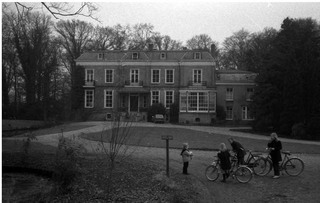
10. De kinderen van Vluchtheuvel in 1945, vlak voor de terugkeer naar Scheveningen.

Van Stolkpark en vertrekken zij vervolgens op 6 december naar de Riouwstraat 43.