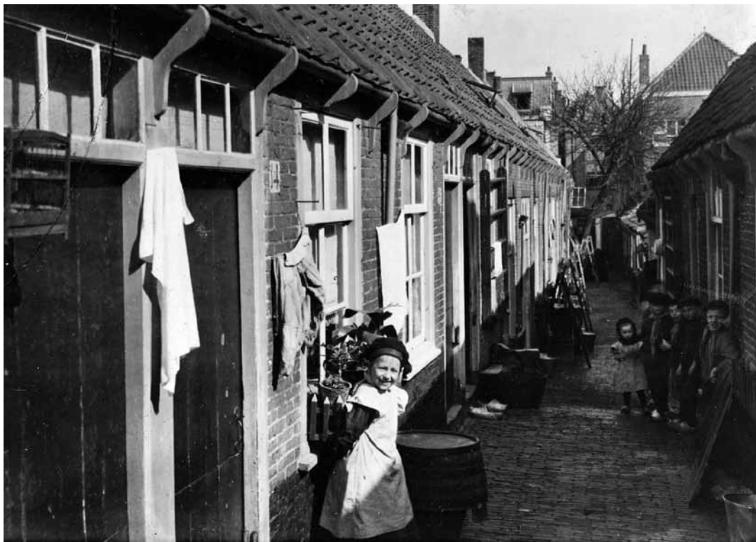
6. Woonomstandigheden in het dorp Scheveningen hofjes rond 1916.

Barmhartigheid hadden hun handen en ook hun huizen vol. Maar op Scheveningen ontbrak nog een dergelijke voorziening. Dat betekende dat Scheveningse kinderen in noodsituaties terechtkwamen in een opvanghuis in Den Haag of buiten de stad. In beide gevallen veroorzaakte dat aanpassingsmoeilijkheden. Zoals Roosje