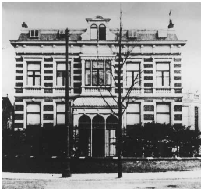
1. Villa Intimis, Duinweg 4, waar Roosje Pierson in 1896 komt te wonen.

De verhuizing naar Scheveningen bleek van beslissende invloed op het verdere leven van Roosje Pierson. Ze maakte kennis met het oude dorp en zijn bewoners en werd niet alleen getroffen door het eigen karakter en de diepgewortelde vroomheid, maar ook door de vaak erbarmelijke