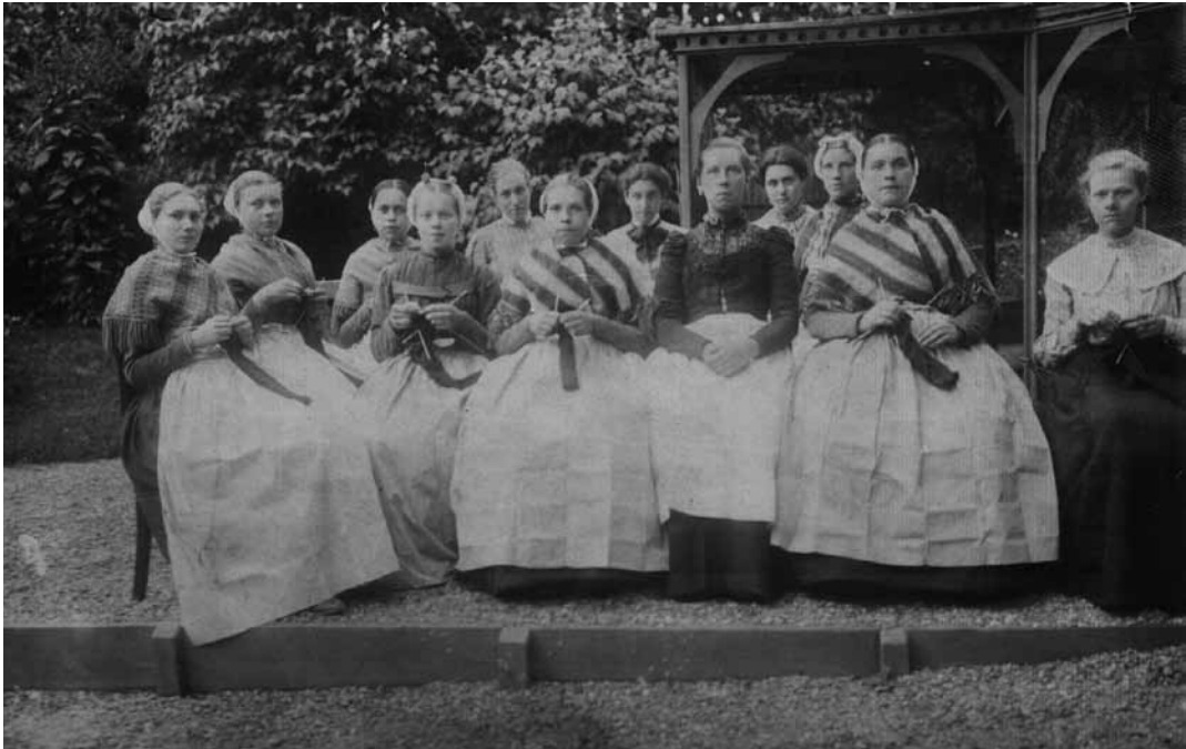
4. Scheveningse vrouwen onder het prieel van Villa Intimis, 1905.

meermalen gewaarschuwd door de politie om toch vooral voorzichtig te zijn. Ze wist echter veel weerstand te overwinnen door haar manifeste wil om de mensen te helpen.