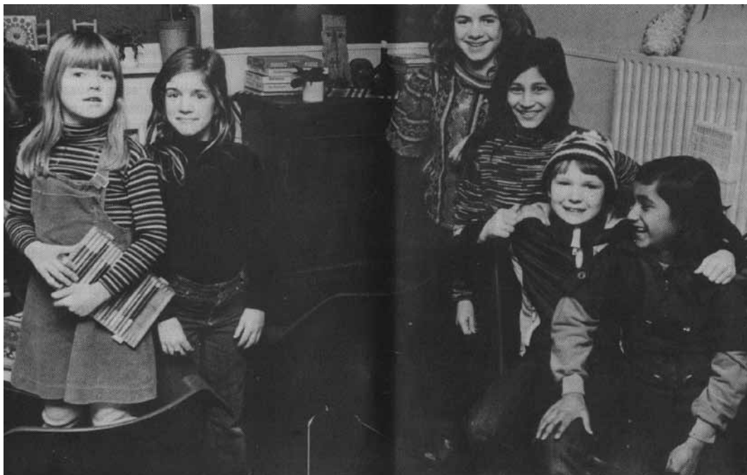
15. De huiskamer van de Vluchtheuvel.

stijgen nog verder als in 1968 de invoering van de 45-urige werkweek een uitbreiding van het aantal leidsters tot acht à negen noodzakelijk maakt. Men kan dit verwachten, want voor het niet-pedagogisch personeel is de werkweek al eerder op 45 uur gebracht.