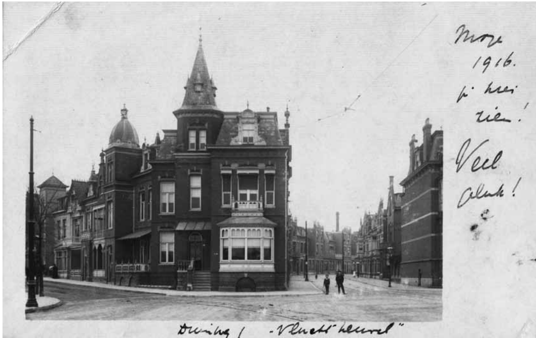
7. Duinweg 1, huize Vluchtheuvel, gezien vanaf de Groene Brug in 1916 bij de oprichting van Vluchtheuvel. Het torentje is als gevolg oorlogsschade afgebroken en niet meer hersteld. Sinds een aantal jaren wordt Duinweg 1 gebruikt als moderne dagopvang voor kinderen. Collectie mevrouw R. van den Berg.

dochter verhuizen dan naar een naburig adres aan de Pansierstraat 13.